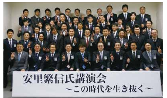
講演会後の記念撮影

担当副理事長として沖繩の地まで打ち合わせに行った五月女副理事長は終了後「多くの方に来ていただき大変ありがとうございました。メンバーの皆様も今回の講演を聞いて得たものをぜひとも今後のJCの活動へと生かしていただけたらと思います。」とコメントをいただきました。また、